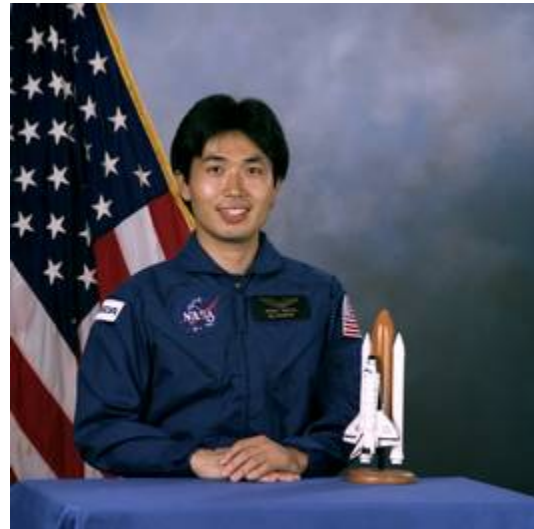
Portrait von 1992 von Koichi Wakata in seinem blauen Fliegeroverall als Astronauten-kandidat.

Im Februar 2007 wurde er als Bordingenieur für die Langzeitbesatzung Expedition 18 zur Internationalen Raumstation nominiert, die für Ende 2008 geplant ist.