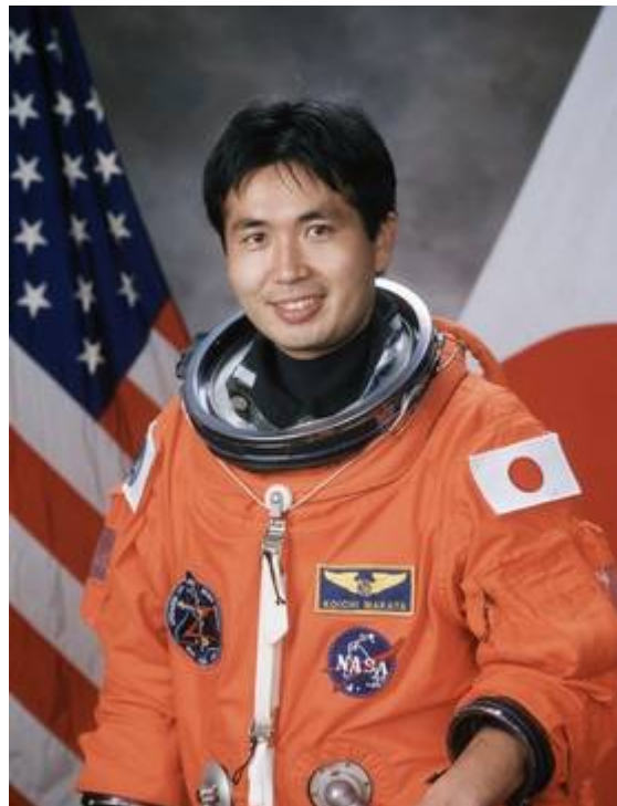
Portrait von 1999 Koichi Wakata in seinem orangefarbenen Raumanzug (ACES) für den Start und die Landung mit dem Space Shuttle.