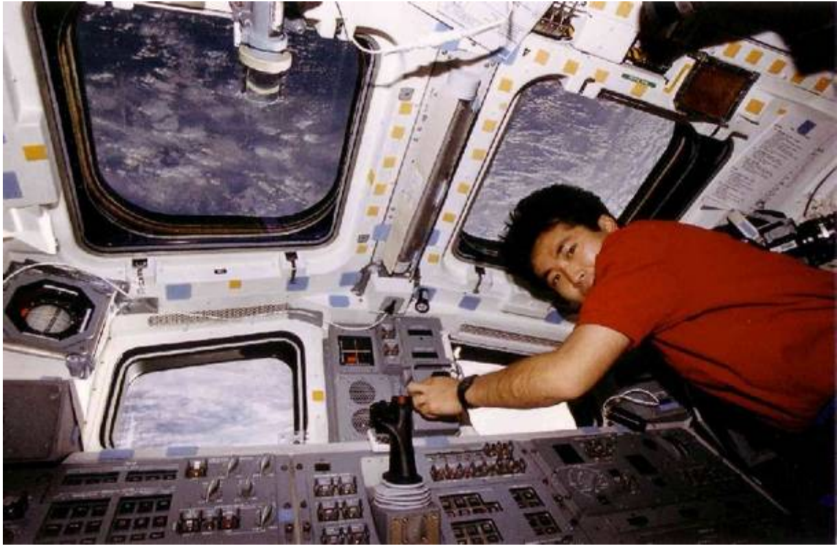
Koichi Wakata bedient während seiner ersten Mission STS-72 den Roboterarm (RMS) im hinteren Flugdeck der Raumfähre Endeavour.

festgeschnallt in unseren Sitzen lagen. Wir konnten aber mit einem Spiegel, den wir benutzten, um die Instrumente und Schalter der hinteren Instrumententafel zu kontrollieren, durch die beiden Fenster oben nach draußen schauen. In diesem Spiegel konnte ich durch das Fenster die Startrampe sehen und verfolgen, wie wir gestartet sind. Beim Start war es durch die etwa 200 m langen Flammen der Feststoffraketen taghell. Der Blick war großartig, und was mich besonders überrascht hat, war diese starke Vibration in den ersten beiden Minuten. Als die Luft dann immer dünner wurde, näher zur Erdatmosphäre hin, sah ich Blitze, wie bei einem Gewitter. Solch einen Blitz habe ich niemals bei den Simulationen gesehen, die wir gemacht haben. Der Aufstieg war fantastisch und mit 8½ Minuten sehr kurz.