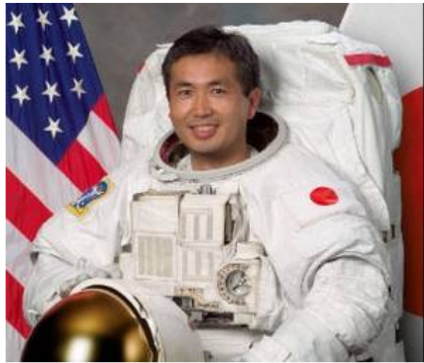
Portrait von 2007 von Koichi Wakata in seinem Raumanzug (EMU) für Außenbordeinsätze.

und mit Motor angetriebene Modellflugzeuge gebaut. Als ich an der Hochschule war, dachte ich darüber nach, dass ich gerne Ingenieur für Flugzeuge sein würde. Deshalb studierte ich an der Universität Luftfahrttechnik. Dann sah ich den Aufruf in der Zeitung, dass die Japanische Raumfahrtagentur Astronauten suchte. Es war immer mein Traum, das Verlangen in den Weltraum zu fliegen, und es interessierte mich sehr, welche Anforderungen notwendig waren, um von der Japanischen Raumfahrtagentur ausgewählt zu werden. Es passiert ja nicht so oft wie in den Vereinigten Staaten oder in Russland, dass Astronauten gesucht werden. Daraufhin habe ich mich beworben und wurde 1992 ausgewählt.